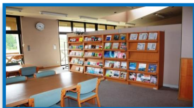
新聞・図書コーナー