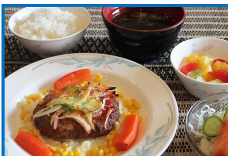
昼食の一例 ピザ風ハンバーグ 420円(税込)