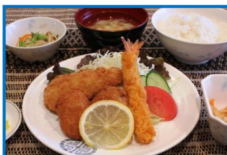
夕食の一例 ミックスフライ 600円(税込)