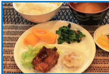
朝食の一例 鶏の照り焼き等 330円(税込)